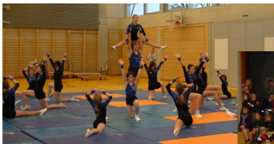
Abb.: Boden-Sektion Jugend

Als erstes zeigten die Mädchen der Gymnastikriege ihr abwechslungsreiches Programm. Danach durfte das Publikum die Vorführung der Boden-Sektion bestaunen.